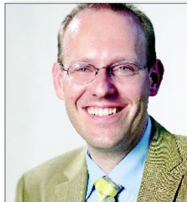
Das Stadtoberhaupt haben in den vergangenen Monaten gleich mehrere Hiobsbotschaften erreicht.